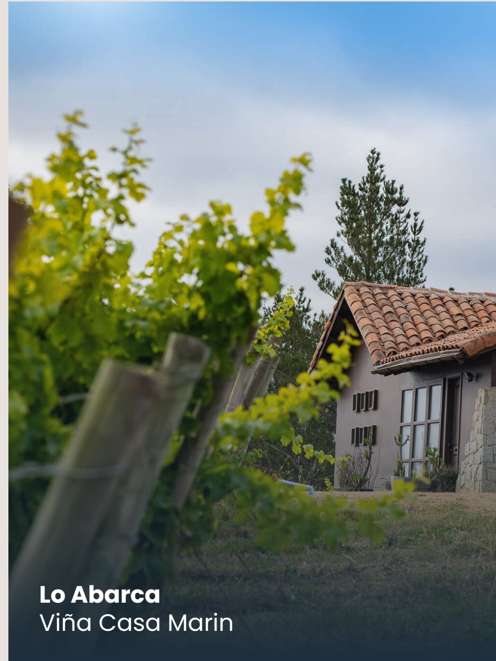
Lo Abarca Viña Casa Marin