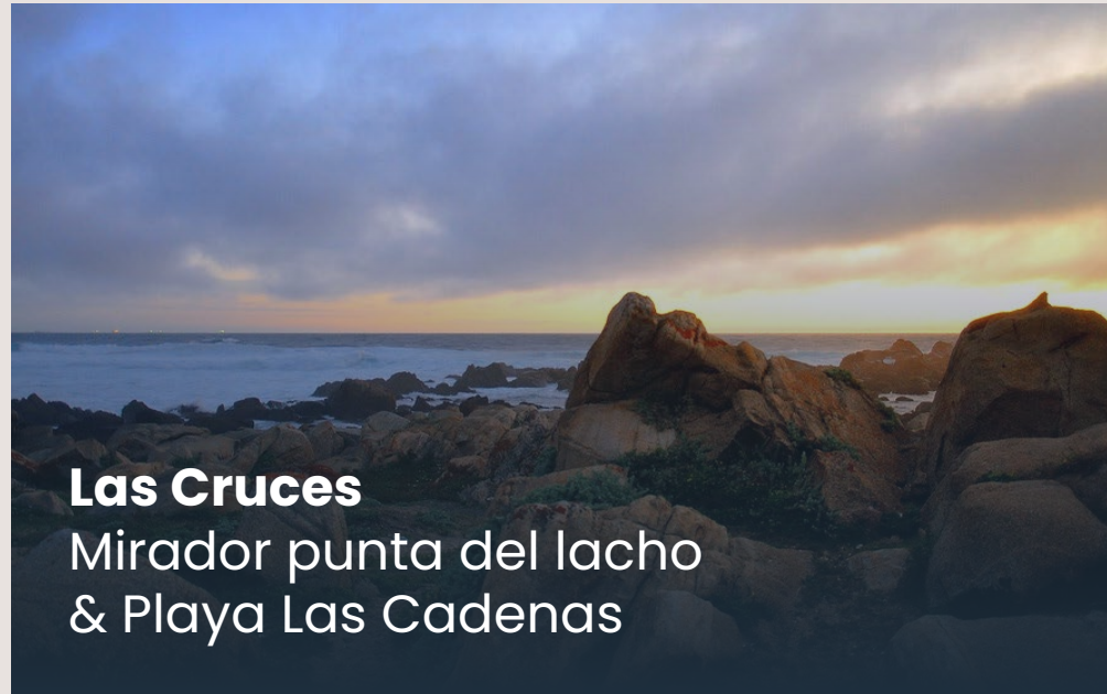
Las Cruces Mirador punta del lacho & Playa Las Cadenas