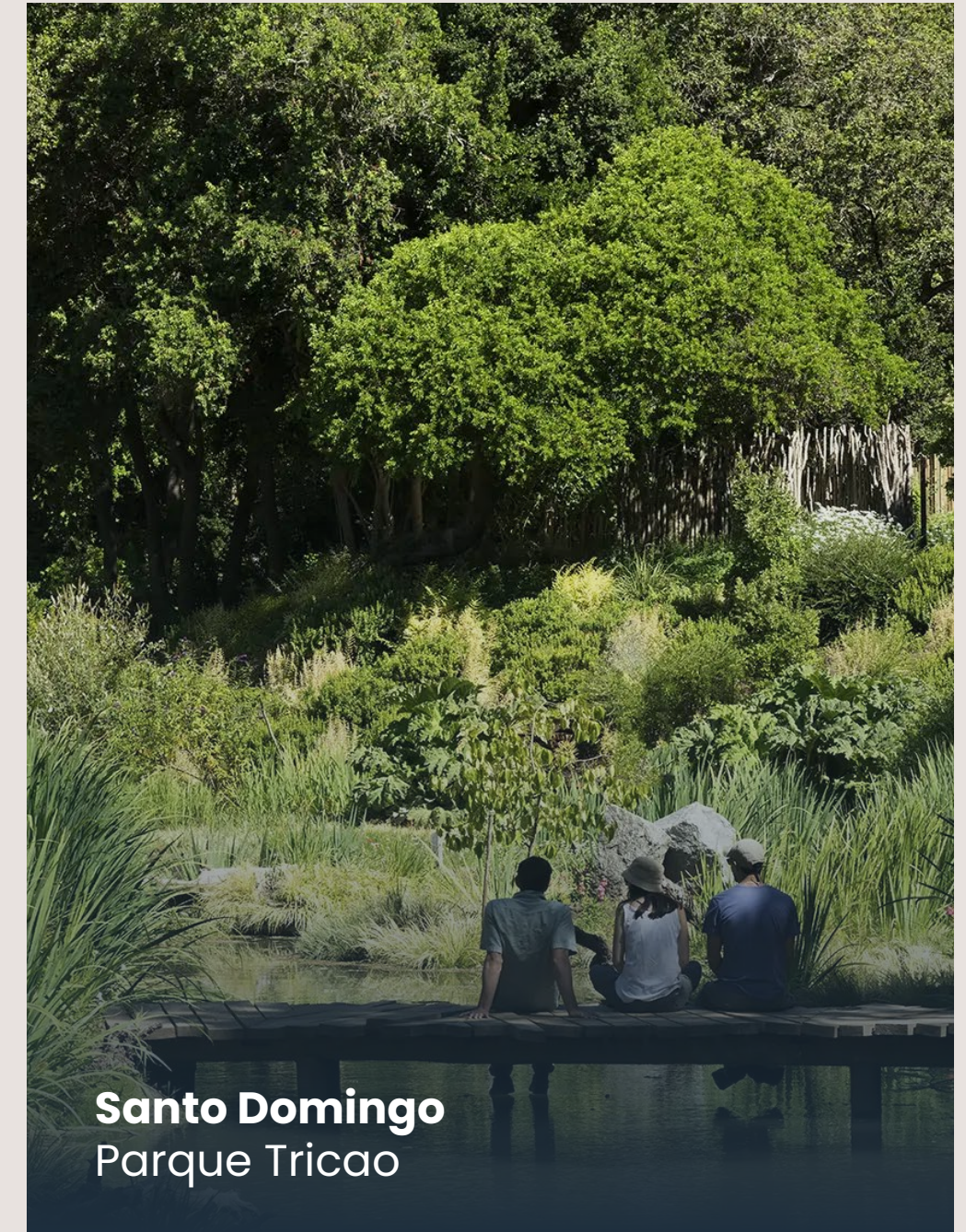
Santo Domingo Parque Tricao