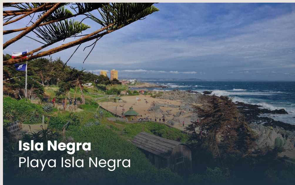
Isla Negra Playa Isla Negra